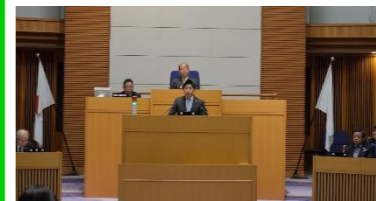
三月に行われた大綱質疑

また、高齢者福祉や、観光、歴史・文化の継承、まちづくり、地域の安心・安全にも、進展が見られる予算です。