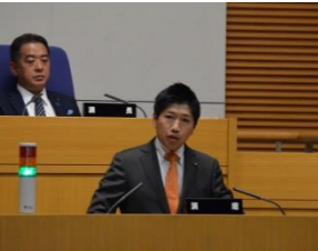
十一月定例会での大綱質疑