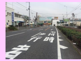
変則交差点に「右折時 歩行者注意」を表示