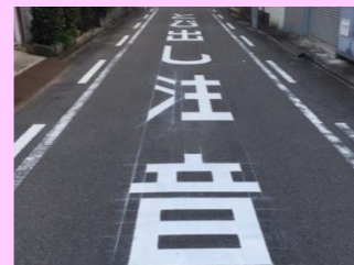
通学路の危険な交差点に「とび出し注意」を表示