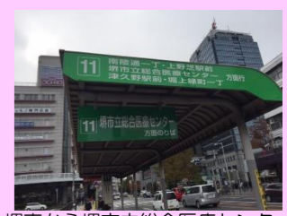
堺東から堺市立総合医療センター行のバスの案内表記がなかったため、追記(南海バスさんに依頼)