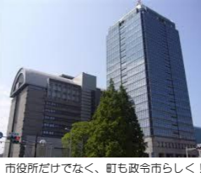
市役所だけでなく、町も政令市らしく！

堺市が政令指定都市になり、今年で十年です。まちづくりは一朝一夕でできるものではないとは言え、市民の皆様の実感して頂けるような成果を示さなければならぬ時期です。今年を、堺の飛躍の一年とすべく、私も粉骨砕身頑張るつもりです。宜しくお願い申し上げます。