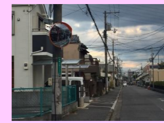
事故の多い交差点にカーブミラーを設置