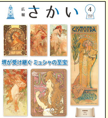
世界有数のミュシャ作品のコレクション 詳細は広報さかい4月号をご覧ください

建設費を節約できても、古いものを使い続けられ、維持管理費用は高くなります。新設なら100年近く使えますから、どちらが得でしょう？ 目の前の建設費に目を奪われすぎです。何より、堺の歴史と文化の重みに相応しいものにすべきです。市長に早期の決断を求めています。