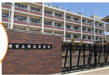
建築インテリア創造課の授業に最適?