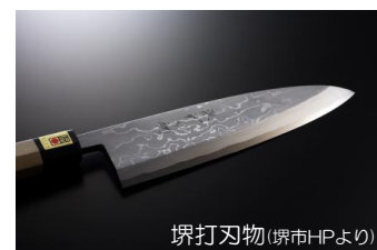
堺打刃物

刃物などの伝統産業の生産力向上のため、設備投資支援の補助金が新設されました。しかし、住宅街にある狭小な町工場も多く、設備投資したくても物理的に困難で、騒音対策にも苦慮している事業所が少なくありません。私は住宅街から離れた場所での協同工場の設置を提案。当局は「伝統産業事業者と意見交換・協議し、課題解決に取り組む」と表明しました。