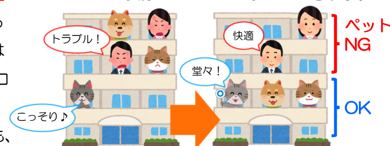
ルール違反の混在から、ルールのある共生へ

よほどマシなはず。民間賃貸住宅の約2割はペットOKです。民間にできて、市営住宅にできない理由はありません。当局は「将来に向けて研究する」との答弁に留まりましたが、私は今後ともご当たり前のこととして求めています。