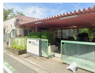
堺区にある教育支援教室

求めてきた不登校支援の拡充が実現。一つ目は、不登校の子の学校外での学びの場となる教育支援教室の受け入れ対象が、「小4以上」から「全学年」に広がったこと。令和3年から5年にかけて、小1の不登校児童が倍になるなど、不登校の低年齢化が進む中、当然の対応です。二つ目はスペシャルサポートルームの設置が前進したこと。「学校には行けるけど、教室には入れない」という子のための部屋です。堺市の約4割の学校で設置済みですが、人手不足で設置