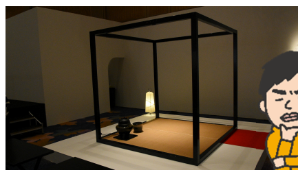
ただの「木の枠組み」にも見える移動式茶室