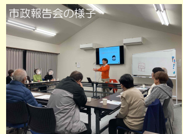
市政報告会の様子

毎年、翌年度の予算が判明する2~3月に市政報告会の座談会を開催しています。今年もたくさんのご意見をいただき、今後の議会活動の参考になりました。ご希望があれば、少人数でも個別開催しますので、気軽にお声かけください。