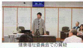
健康福祉委員会での質疑

政令市トップレベルの財政 昨年度の決算を審議する、八月議会が行われました。堺市は、全国200の政令指定都市でも、 トップ3 に入る 健全財政を維持 しており、当面は安定した財政運営ができる見通しです。 しかしながら、少子高齢化が進む中、納税する現役世代が減少していくと見られるわけはありません。また、市の活性化を図る上で、何でもかんでも節約するのではなく、時として、積極的にお金を使うべき場面もあります。その最たるものが「子育て支援」です。