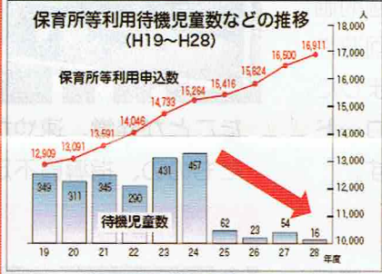
待機児童ゼロまであと一歩!