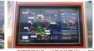
堺まで延伸される日は来るのか?