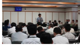
総務財政委員会での質疑

また、特別委員会は、「子どもと女性が輝く社会実現調査特別委員会」の所属となり、副委員長を拝命しました。子ども・子育ての問題は、私のライフワークでもあります。こちらでもしっかりと務めを果たして参ります。